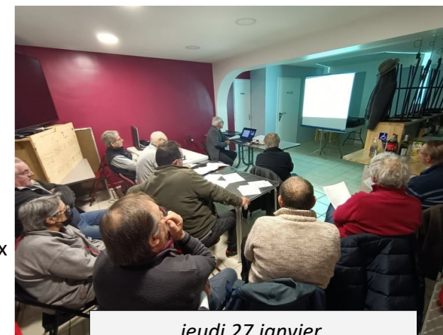
jeudi 27 janvier, Assemblée Générale 2022 de PLS.

Pêche à la truite au lac, initiation au fouet à la mouche pour adulte.